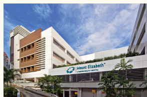
Mount Elizabeth Hospital