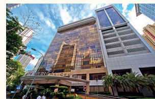
Parkway East Hospital